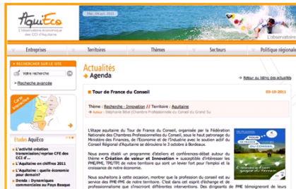
Presse Book Etape « Bordeaux »

Etape 3 : Caen Mémorial le 1 er décembre 2011 Entreprises, sortez de vos cages ! Une analogie entre le monde de l'entreprise et l'animal... ou quand le monde animal permet d'inspirer des stratégies d'adaptation et d'innovation aux entreprises !